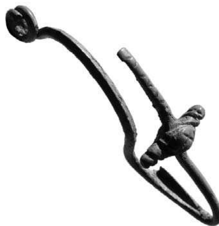
Слика 3 - Бронзана фибула познолатенске шеме Figure 3 - Bronze fibula of late La Tene culture

the depth of 0.9 m. An identical situation occurred in Sector III where one trench was excavated, 7x2 m in dimension. An almost identical layer of black, moist and compact soil was also registered in trench 2 in Sector I where it was defined as a dugout, i.e. a sudden decline of subsoil along the south-east section. This occurrence indicated that most of the site was probably destroyed by cultivation of the land when shrubs and small trees, that used to grow here, were removed. Pottery found in these trenches could be classified into two groups. The first group, smaller in quantity, is represented with pottery shards with the characteristics of the Late La Tene culture. The second group would be Roman provincial pottery, mostly vessels made of clay tempered with sand and crushed shells. The most common vessel shapes are pots with band shaped rims, dated to the end of the 1 st to the 4 th century AD, and various types of lids dated to the second half of the 3 rd and 4 th century AD. Tableware is made of well refined red clay and represented by bowls, smaller pots and jugs dated to the 2 nd century BC. Among metal finds, a silver coin of Emperor Trajan stands out,