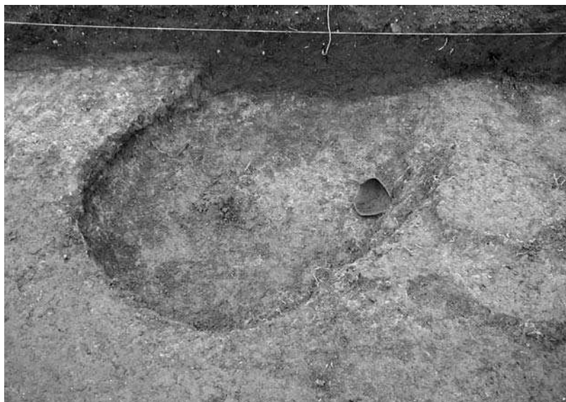
Слика 1 - Изглед Јаме 1 током пражњења Figure 1 - Pit 1 during excavations

Both of the pits contained pottery characteristic for the Late La Tene culture, mostly grey ware produced on a potter wheel out of well refined clay. The greatest in number are bowls with "S" shaped rims, pots and lids. A number of vessels, mostly pots, produced on potter wheels or handmade, were made of clay tempered with crushed shells or sand. Pottery with such characteristics is chronologically insensitive and as such is common for the period from the end of the 2 nd century BC to the end of the 1 st and beginning of the 2 nd century AD. Closer chronological determination is only possible in cases where this pottery is found in a closed stratigraphic context with some other chronologically sensitive archaeological material.