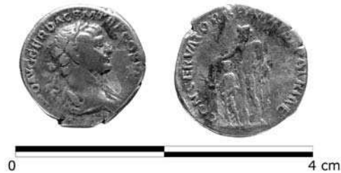
Слика 2 - Сребрни денар Трајана 112-114. година Figure 2 - Emperor Trajan's silver Denary 112-114 AD

the depth of around 1.4 m, which was the level of the IV arbitrary layer. At this depth, a layer of subsoil appeared in the form of yellow clay with loess concretion. Archaeological material was present up to